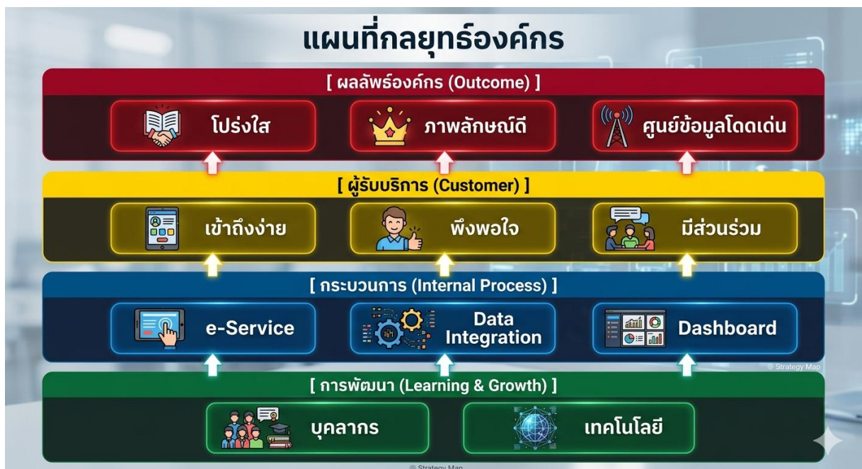
ภาพที่ ๑ แผนที่กลยุทธ์ (Strategy Map) ศูนย์ข้อมูลข่าวสารของราชการ

๓.๕ สร้างการรับรู้เกี่ยวกับศูนย์ข้อมูลข่าวสารของราชการ เพื่อเพิ่มจำนวนผู้เข้าถึงและการใช้บริการ