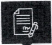
ระบบงานสารบรรณ Eoffice