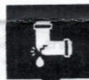
แจ้งประปาเสีย