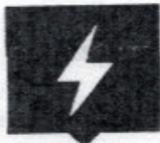
แจ้งไฟฟ้าสาธารณะ