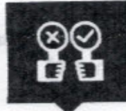
แบบสำรวจ ความพึงพอใจ