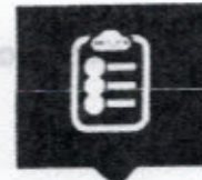
การประเมิน ITA