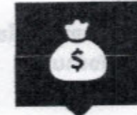
ชำระภาษีออนไลน์