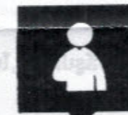
สภาดูอุบัติเหตุ