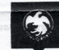
จัดซื้อจัดจ้าง e-GP