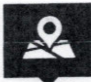
ร้องเรียน ร้องทุกข์