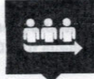
จองคิวออนไลน์